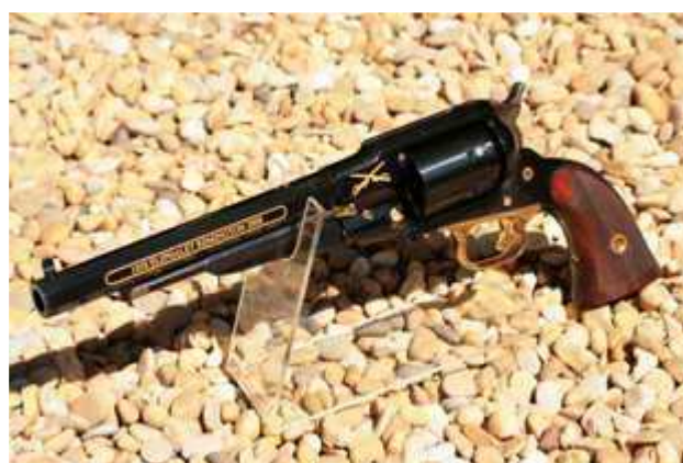
(A gagner sur le challenge annuel de la Melgrienne de Tir)