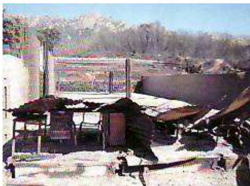
(Stand de Carbuccia après l'incendie)