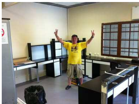
Tic ou Tac ?