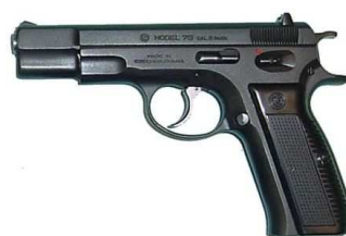
Le CZ75 Black