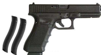
Le Glock Gen4